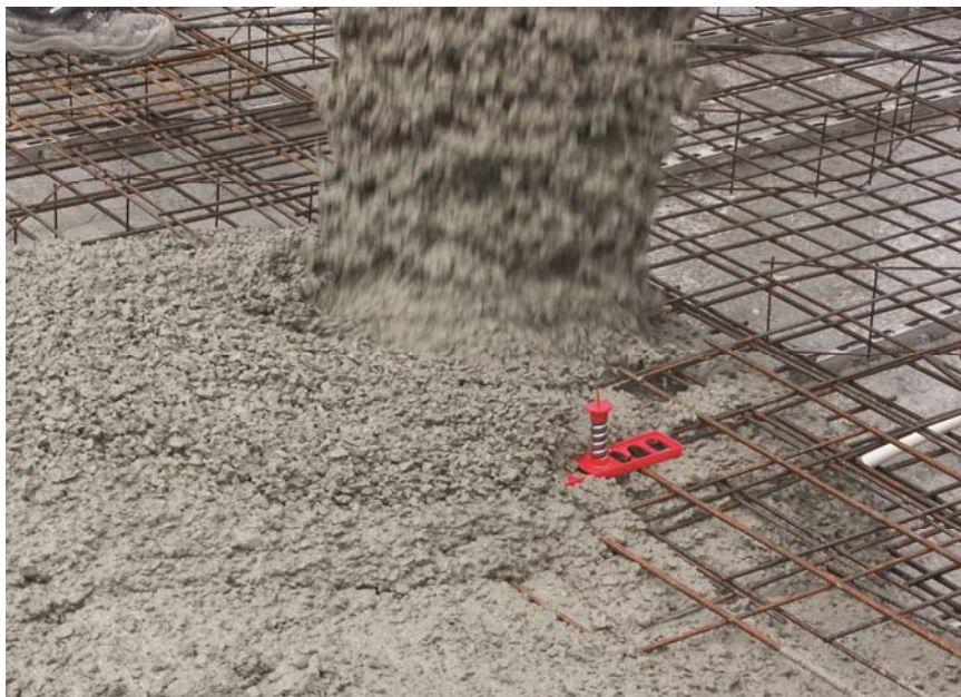
BU: RÖDELFIX sitzt fest auf der Bewehrungslage und hält dem eingefüllten Beton problemlos stand.