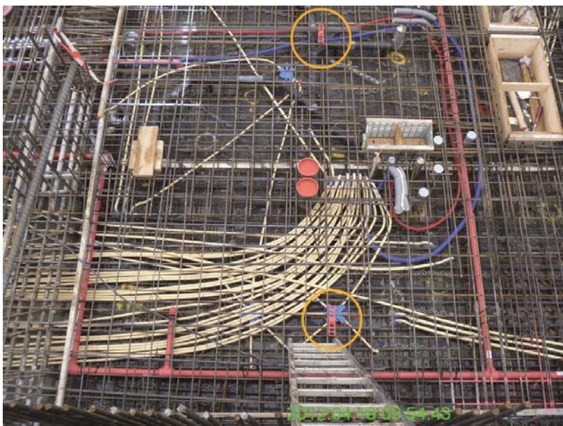
BU: Keine Beschädigungen der Leitungen und Kanäle mit RÖDELFIX