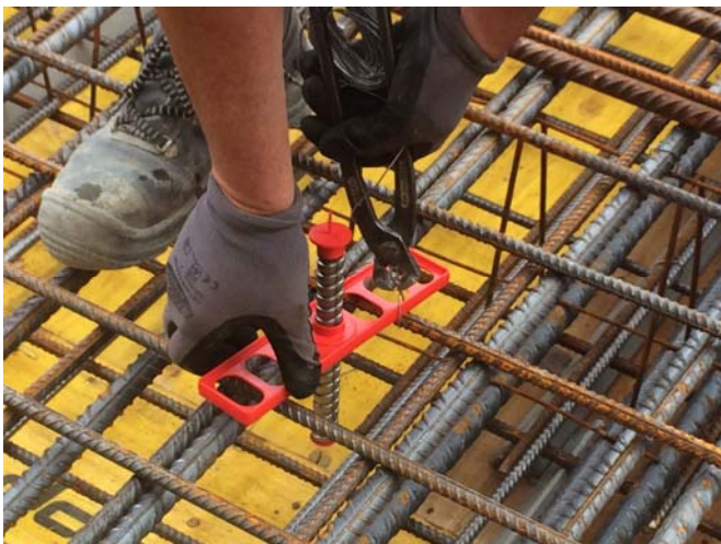
BU: RÖDELFIX wird mit Bindedraht befestigt.