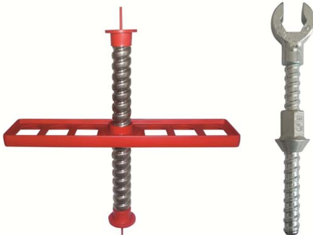
BU: Einbausatz RÖDELFIX mit Anschraubset