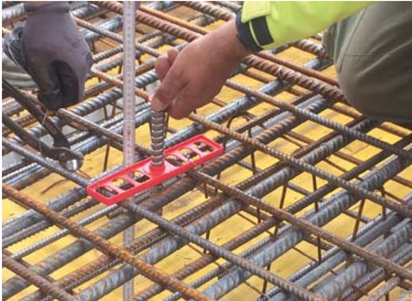
BU: Die Höhe der Hülse kann auch NACH dem Befestigen noch justiert werden.