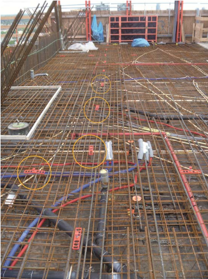
BU: Einfache Positionierung in der Bewehrung