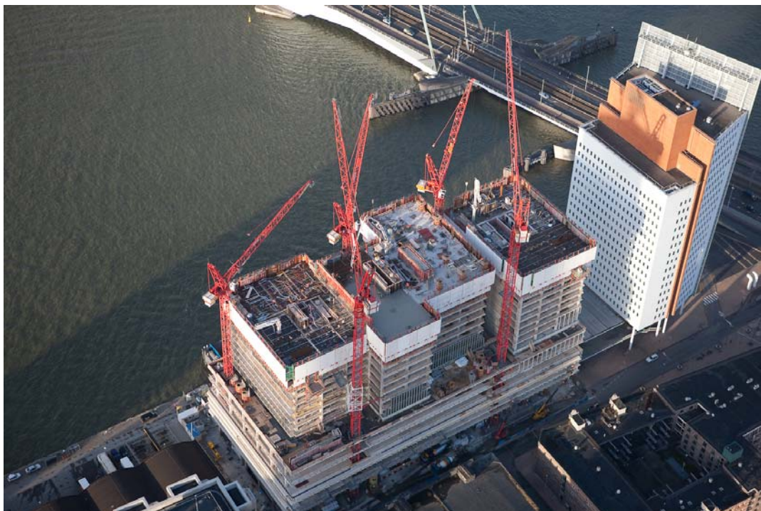
BU: RÖDELFIX im Einsatz: Bauvorhaben „De Rotterdam“